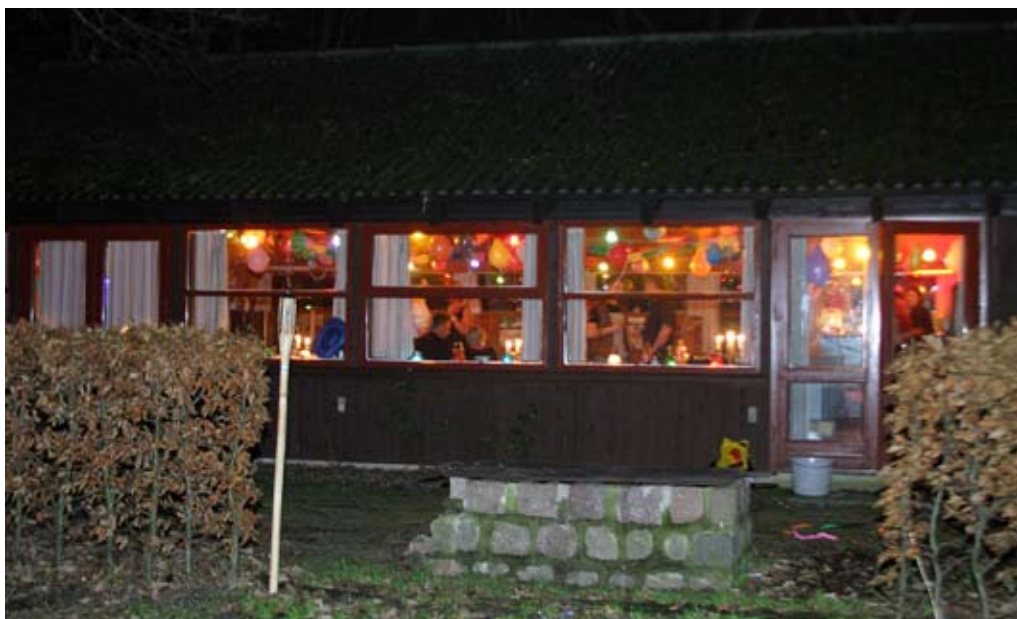
Sådan var udsigten fra ryge rummet, senere på aftenen.