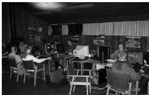
Pænt fremmøde af spillere

Igen i år lykkes det at afholde LanParty i SBBU klubhus. Der var ikke specielt stor fremmåde, men vi var nok til at gennemføre det. Vi fik også besøg af flere klubmedlemmer i løbet af weekenden, og det er ganske hyggeligt. Det er svært at beskrive den stemning som der er under et LanParty. Det skal simpel hen opleves, så hvis nogle er interesseret så kig ned næste gang vi afholder LanParty. Man kan jo lige smutte forbi når man alligevel skal gå en tur om søen!