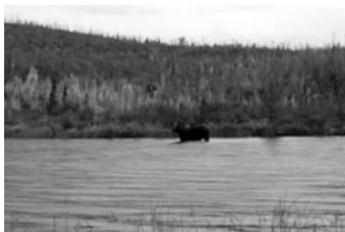
En smede ælgtyr der vander.

det var en stor grizzly. Da den forsvandt, var jeg så forhippet på at finde ud af hvad det var at jeg næsten var på vej op ad skrænten for at undersøge sagen. Men mig og mit indre jeg, fandt dog til sidst ud af at det nok ikke var så fandens klogt, så