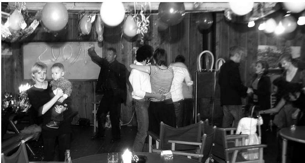
Fest og ballade på dansegulvet, lidt før kl. 12