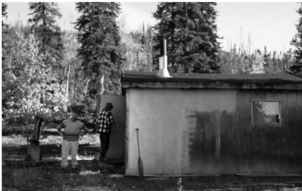
En forladt fanger hytte

Efter den lange smalle Austin Lake, ændrede floden endnu engang karakter. Vi havde nu omkring 40 km. tilbage før den løb ud i Store Slave Sø.