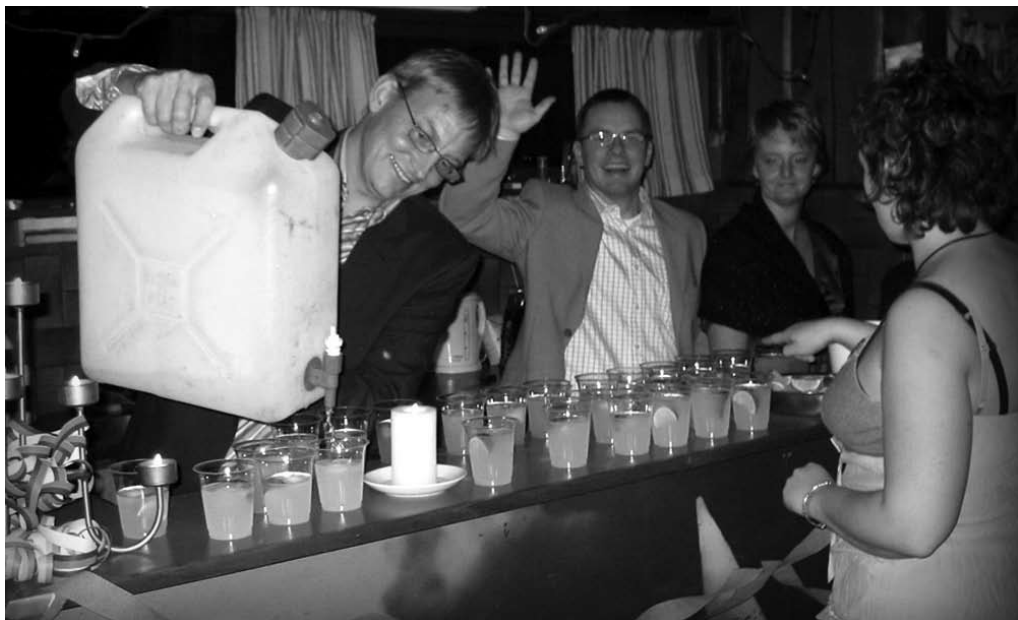
Ole Lyd skænker pomada velkomstdinks til alle