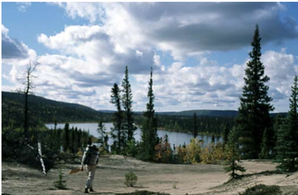
Kim, på en 800 m. overbæring fra Eileen til Snowdrift river