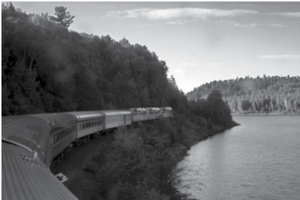
Toget snor sig gennem Ontarios skove, på vej vestpå