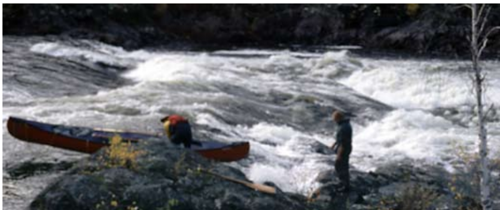
Her bliver der båret udenom nogle hæftige fosser