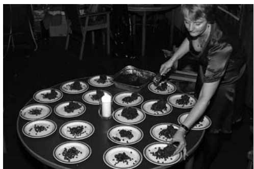
Her laves deserten af Charlotte