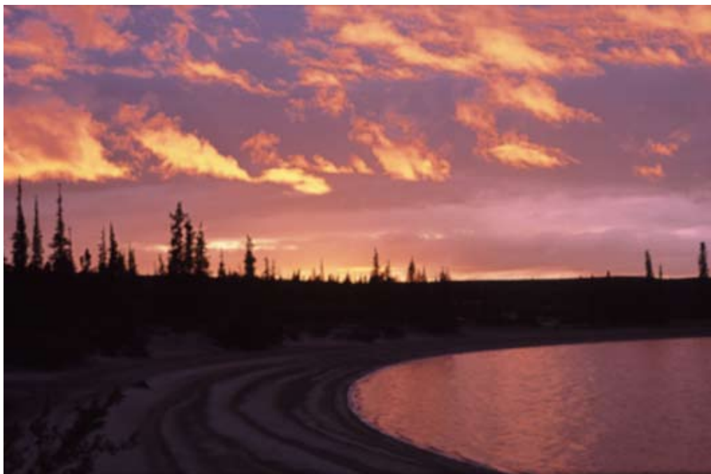
Solnedgang over Norwegian Lake i Canada