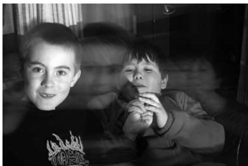
Spøgelsesdrengene var i deres es