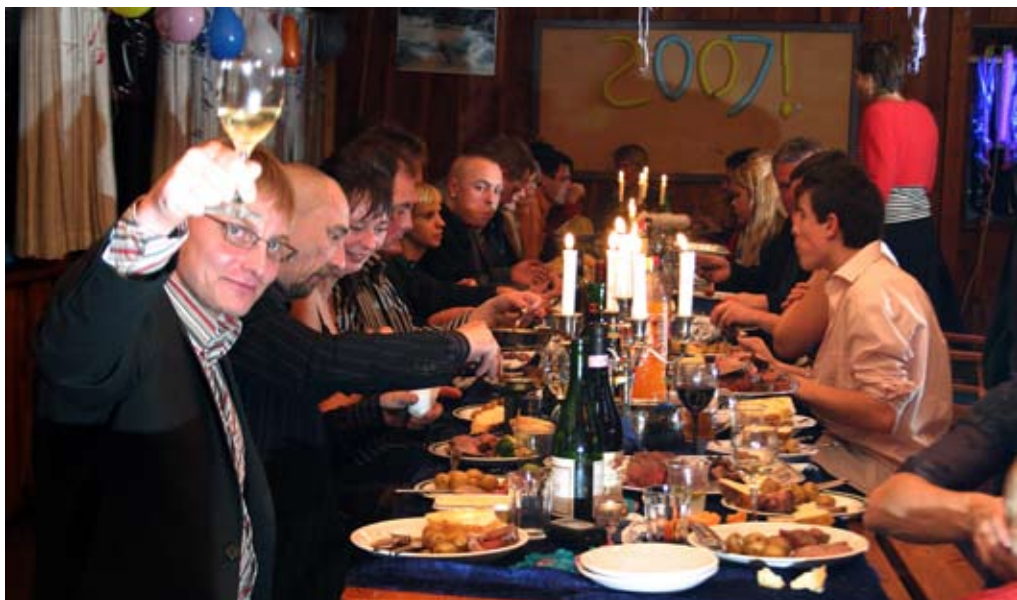
Langbordet var dækket med lækker mamse