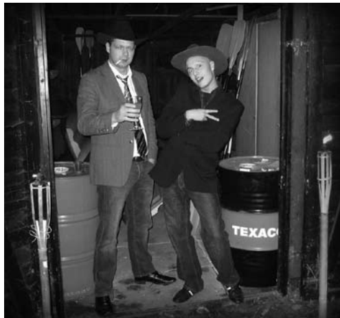
To cowboys i rygerummet

Efter middagen og fælles afrydning og opvask, blev der fyret op til klinkedans/slingrevals for alle.