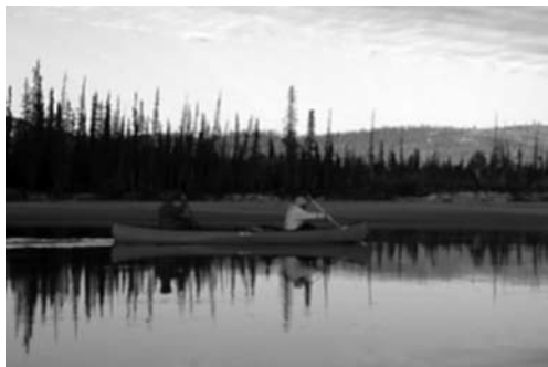
Stille padling på snowdrift og alle 3 hygger om bålet

vi lå der og overvejede situationen kom jeg til at kigge ind på bredden og lige der 30 m. fra os sprang en jærv rundt. Den forsvandt op ad klipperne efter måske 10 sek. Men vi så den! Jærven er et fascinerende dyr, den går for at være det hidsigste dyr i skoven, men lever hovedsageligt af ådsler. Det