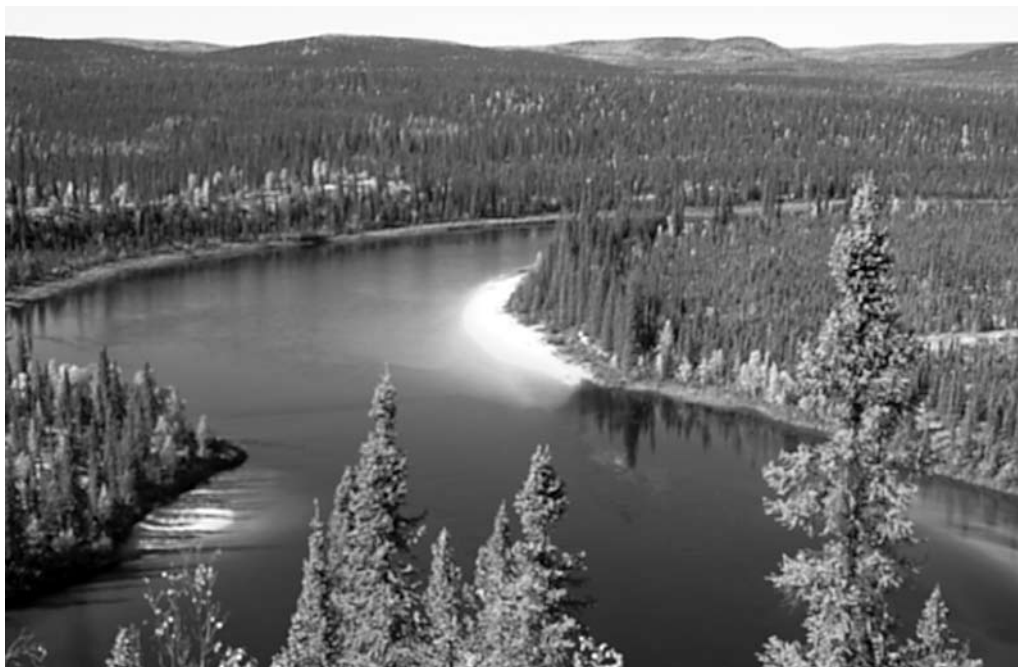
Snowdrift river flyder stille gennem landskabet