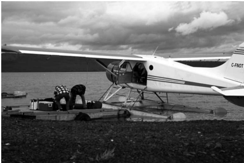
Grejet bliver læsset om bord i den gamle "beaver" vandflyver

Det var begyndelsen på september og vi var klar over at det normalt stabile vejr i Nordvest Territoriet kunne komme til at byde på både høj sol og piskende storm i højere grad end om sommeren. Vandflyveren gled op på en lille sandstrand på Norwegian Lake. Vi fik læsset af og piloten råbte en sidste gang om vi nu havde alt, før han gav gas og forsvandt ud over tundraen. At stå der efter