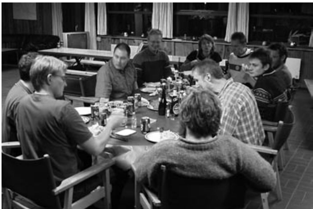
Her var så den lille flok som var samlet inden jul