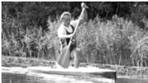
Lydmanden i kampform

Hver dag møder man folk i klubben, som lige skal en tur på søen og have lidt frisk luft. Det er sjældent træningen er organiseret blandt flere, men det kan den blive, hvis man ønsker det og selv tager initiativ til det. De seje træner fast mandag kl. 17, og her er alle velkomne – også selv man bliver nødt til at snyde hjørner for at følge med. Så hvis du mangler nogen at træne med, så lav et opslag på opslagstavlen eller skriv et indlæg på hjemmesiden.