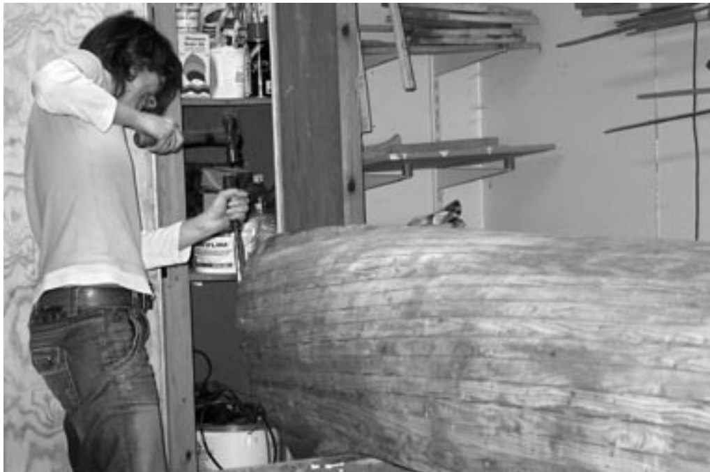
Der blive arbejdet med hammer og stemmejern

Alt i alt, er der gang i den hele tiden og vi