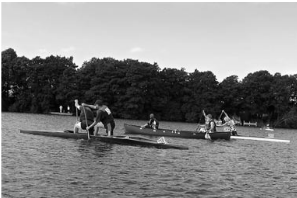
C2 starten er gået og båd nummer 249 kommer rigtig godt fra start