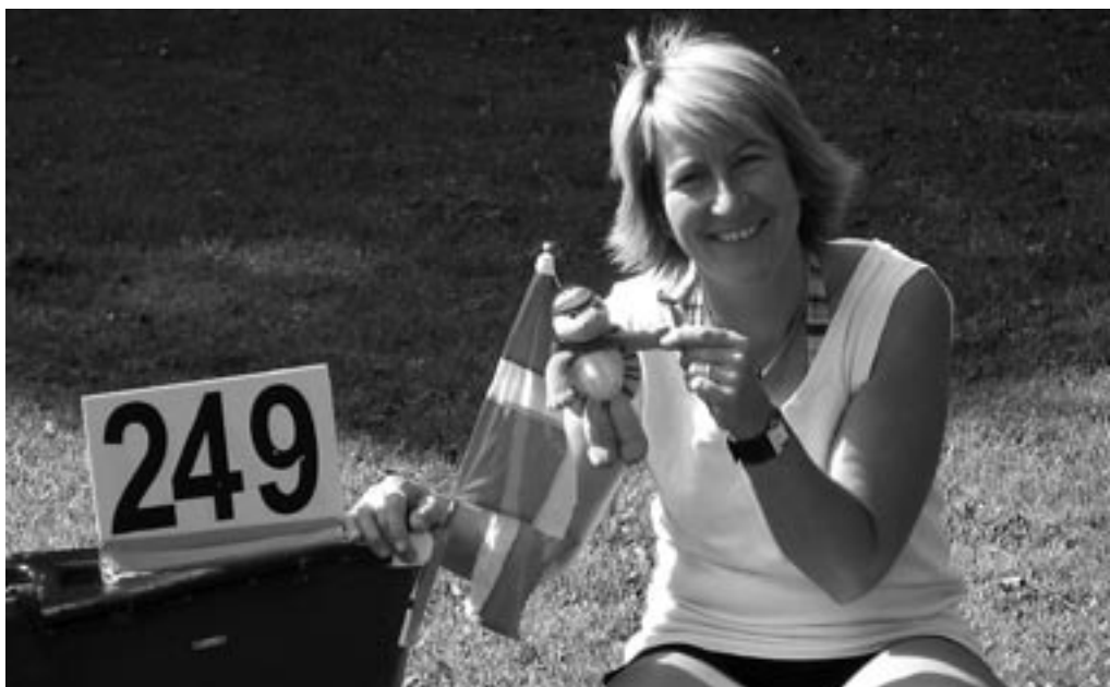
Ea, Maskotten og båd nummer 249 midt i et ritual (billede beskåret)

Mens vi sad her og filosoferede over vores glimrende start i løbet. kom de 2 andre kanoer forbi, vores "drikkedunke" blev tomme og vi trængte til at røre armene