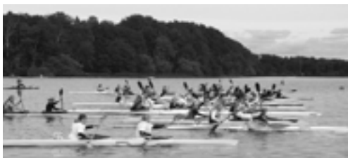
K2 start i Mølleåens Blå Bånd