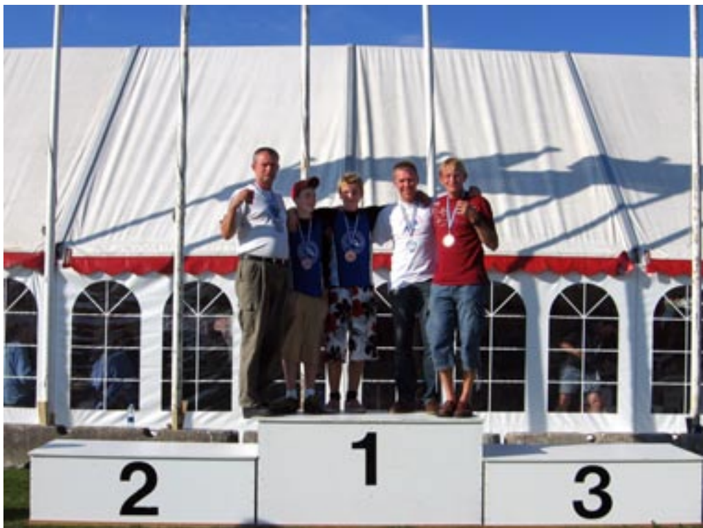
Gulddrengene fra Kanoklubben triumferer på Tour De Gudenå skamlen