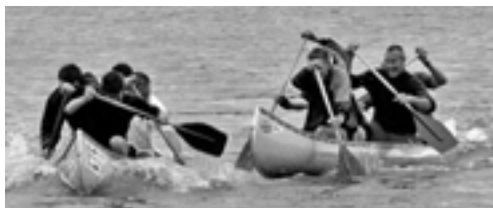
Bombe 4 klubmester opgør