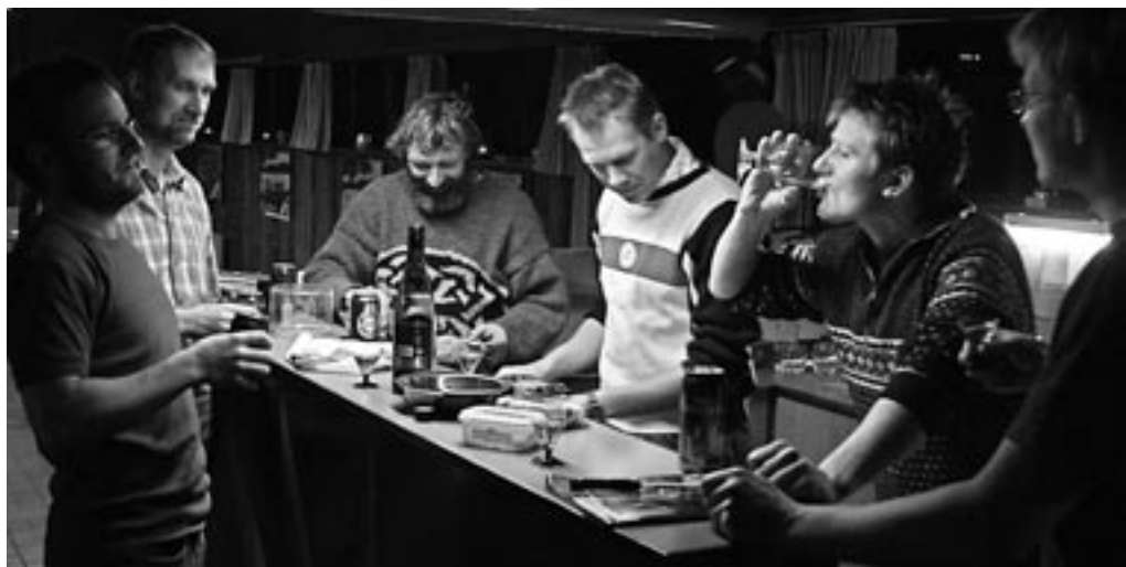
Lærlingen skubbede vand ind fra start og opførte sig som sædvanelig eksemplarisk