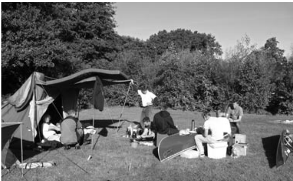
Kanoklubbens lejer i Bjerringbro

Om morgnen inden der er rigtigt liv i alle, går Hvid af sted til Brugsen for at købe morgenbrød. Laaaang tid efter kommer han endelig tilbage (med tydelige rester af