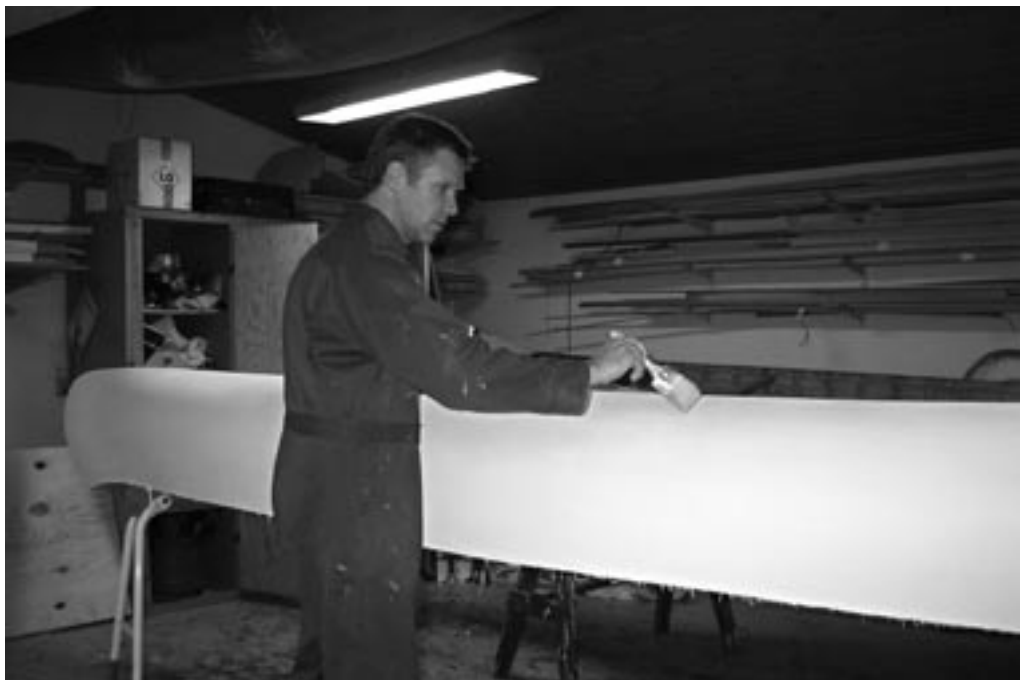
Der bliver lagt næsten sidste hånd på værket, malingen