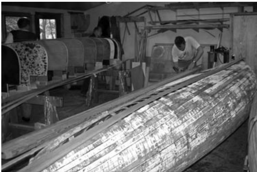
En kano af ældre dato skal laves så god som ny