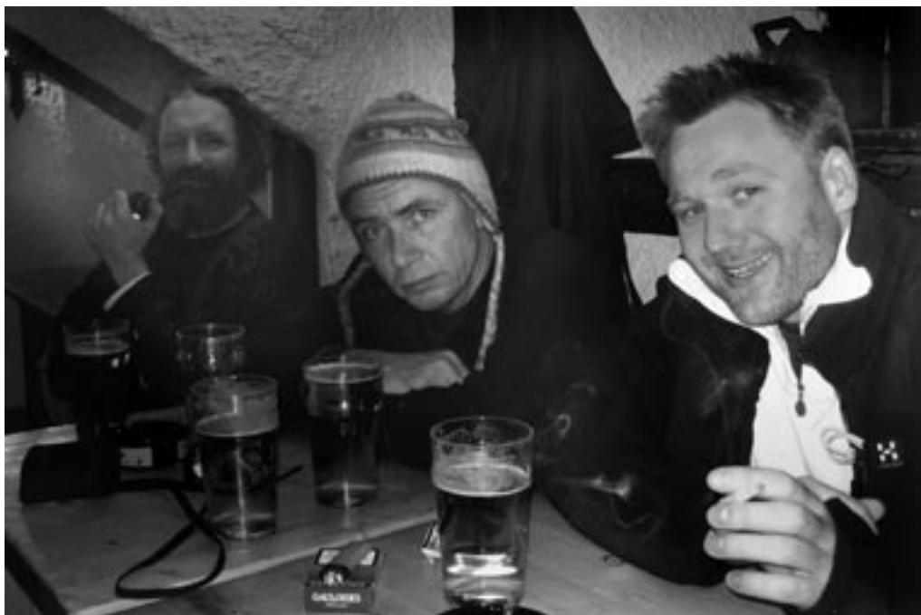
Selvom vi føler os lidt gamle og slidte er der mod på mindst 2 halve fad hver dag