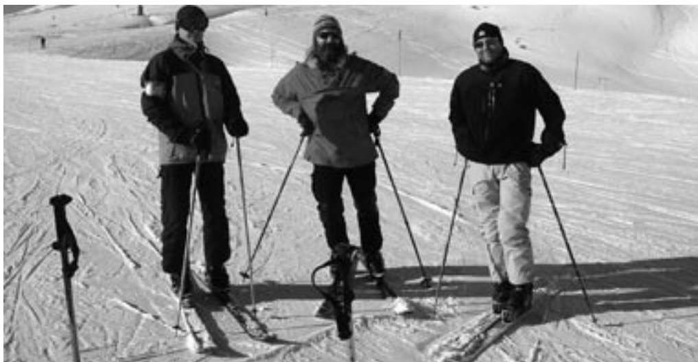
Tele hajerne i bumsetøj og plastik støvler