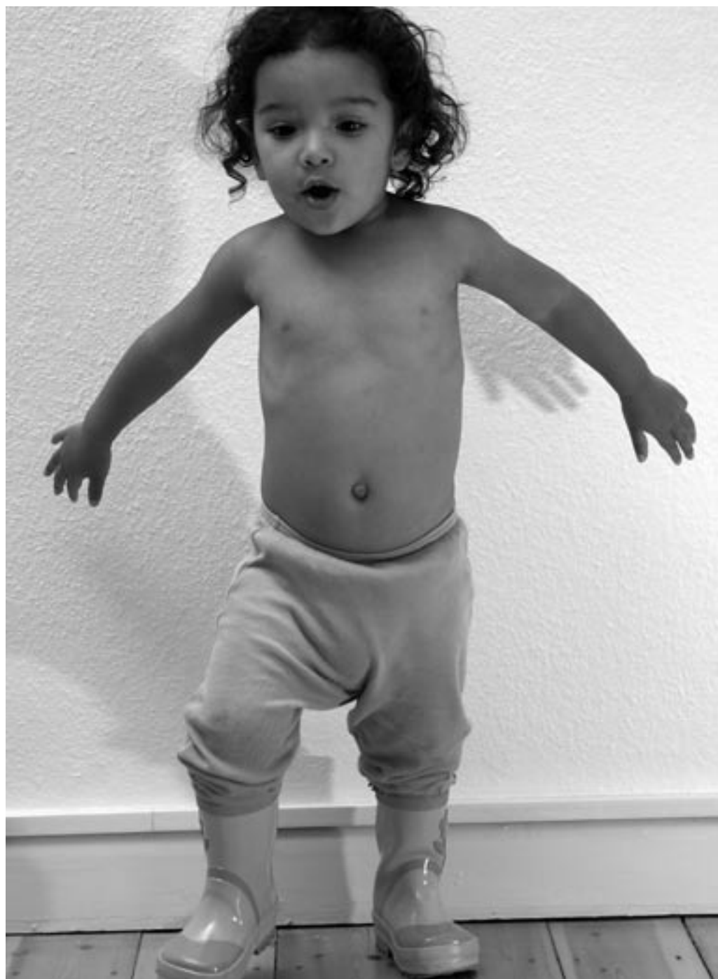
Plus pigen på slap line