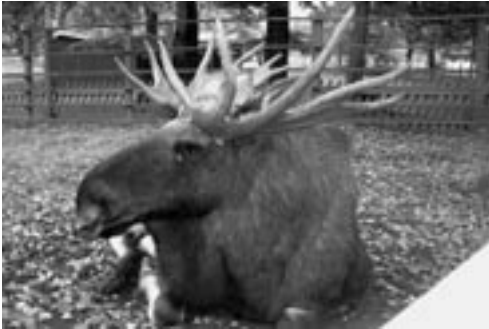
En smede bambi