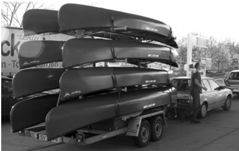
10 kanoer lastet på trailere og så på vej hjem til Danmark igen

En dag sidst på oktober mødtes Ole og jeg i klubben ved 21 tiden. Pust havde været så søde at låne os deres 8 kanos trailer og snart var vi på vej sydpå i Birgiths 12-14 år gamle mazda. På en god bakke (nedad