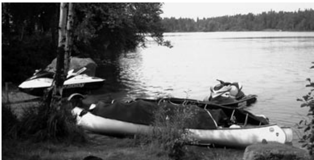
Kanoer på slæb efter jetscootere