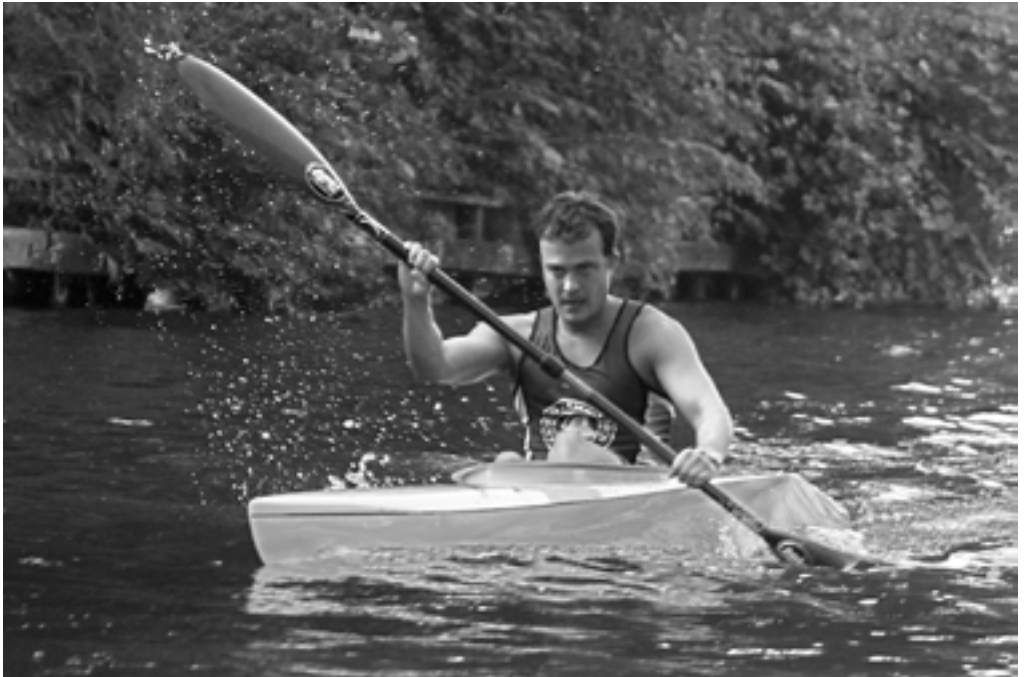
En tændt og koncentreret idrætsformand på vej over målstregen

det blev til flere præmier, som vi med stor glæde indtog i saunaen senere. Undervejs var vejret fint, og det er første gang jeg ror over Furesøen uden en bølge på overfladen. Lækkert. Til gengæld manglede kræfterne en smule, men det er jo hvad der sker, når