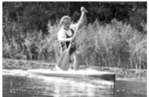
Ole lyd var presset