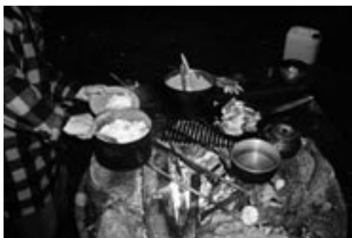
Lærlingen tryller med gryderne

nej bare konstant fin/støvregn, det har det gjort lige siden vi forlod dæmningen. Lige nøjagtig så meget at det virker pænt irriterende. Der ligger et vindskydd et par hundrede meter længere oppe. Vi vælger at løbe derop med de vigtigste ting, dække kanoerne til og få startet et bål op og se tiden an, inden vi slæber resten op. Vi bliver her enten ved skyddet eller ved kanoerne. Østrigerne er kørt herop for udelukkende ligge her på pladsen ved Jule/Åby hele deres ferie!!! Han har været her sammen med kammerater for 5 år siden. Udsigten fra højen camperen står på er altså også betagende. Du ser ud over Helgasjön de 8 - 10 km ned til Växjö. Vi bliver her på pladsen i to dage. Vores daglige gøren og laden sker her ved skyddet og bålstedet, nætterne fortrækker vi ned til kanoerne på den lille strand et par hundrede meter herfra. Her på anden dagen på pladsen går vi alle fire på udforskning i den store barske svenske natur, efter store væltede træer til vores bålsted. Læriling og ungerne går på blåbærjagt og får samlet vildt mange og så bliver der lavet blåbærmarmelade til aftenens pandekager. Den næste morgen er det rigtig godt vejr, varmt og med blå himmel. Vi benytter denne kærkomne lej-