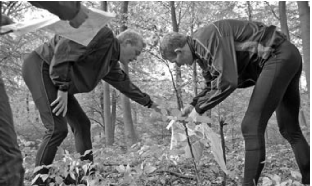
O-løb vinteren igennem