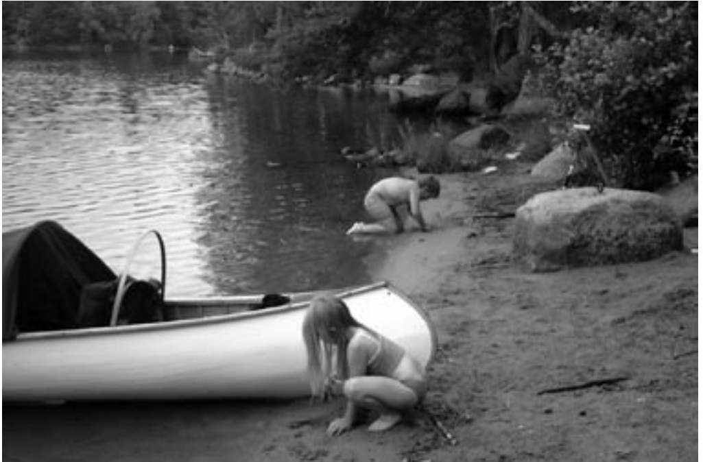
Malthe og Sif er på stranden

Vel fremme 4 - 5 km sydvest for Asa van-