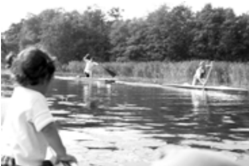
Men Ole nakkede forfølgeren