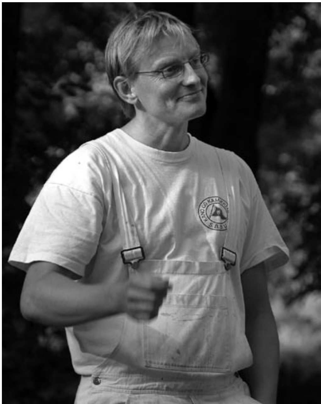
Der var både rosende og motiverende toner i Lyd formandens standerstryg tale