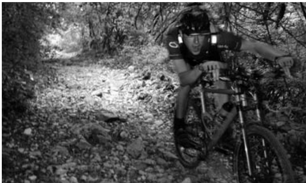
Fuld skruge MTB ved Bagsværd sø