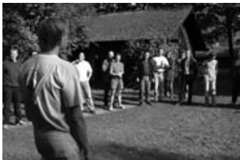
Der var troppet en del op.

Lørdag d. 8. oktober 2005 Ved 10 tiden begyndte medlemmerne at troppe op til det indkaldte pligtarbejde. Det var medlemsnumrene 001 - 090. Alle K -numrene (nr. står på din adresselabel) der var indkaldt. Enogtyve dukkede op, nogle enkelte havde meldt afbud. Opgaverne blev uddelt: 3 - 4 personer blev sendt i bad, omklædning, sauna, vægtrum og toilet/vaskemaskine-