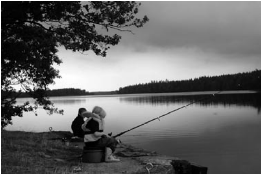
Der fiskes efter de helt store gedder

vi ud på Tolgasjön. Hen på eftermiddagen kom vi en ny stor plads ved Sundäng, men den var uheldigvis indtaget af en eller anden stor spejder division. DET VAR IKKE LIGE OS! Vi havde set en plads med skydt og det