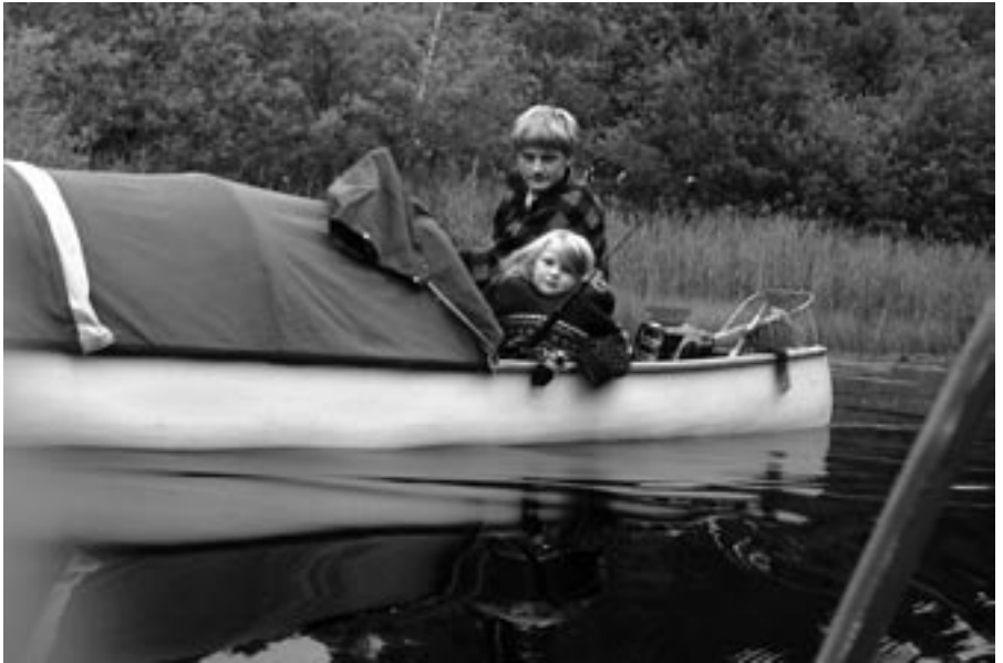
Lærlingen og Sif-pigen på tur med Vikkel og Malthe