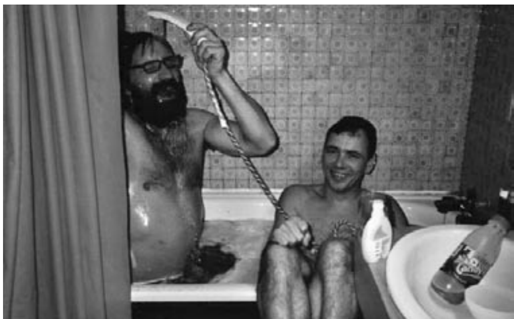
To paphoveder som har det ret sjovt i badekaret efter afterskiing