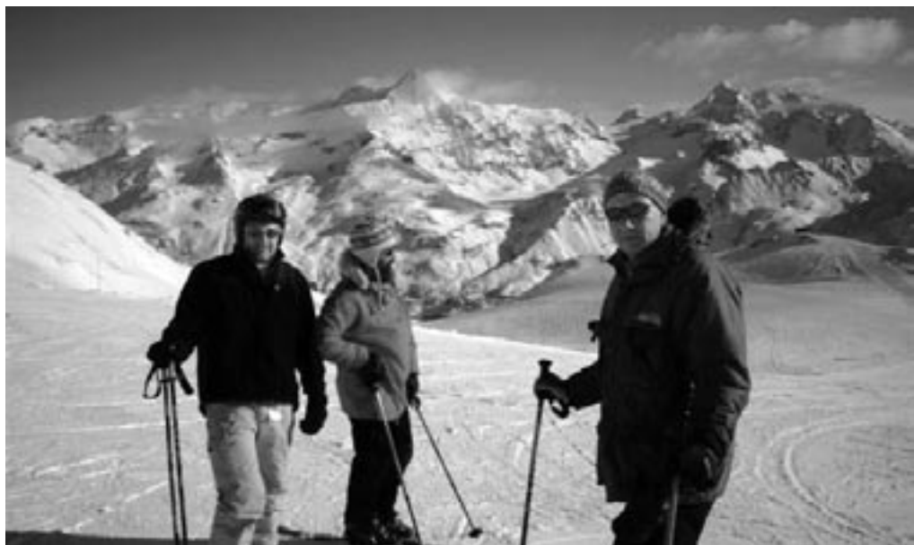
Lækker sne og lange sorte pister