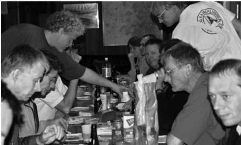
Vikkel og klubben havde disket op med en god kold frokost