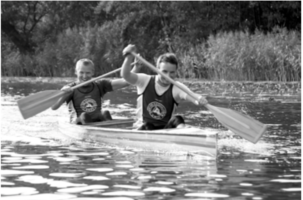
De glade drenge Butt og Håndmad for fuld skrue over lyngby sø

Holdet havde forberedt sig godt til dette vigtige løb, og nerverne på plads til den