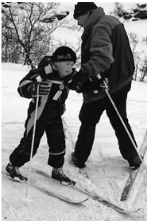
Vikkel og søn. Ideel tur for børn

Fjellheim Lejrskole, 2875 Grindeheim. Vang i Valdres. Pr. Fägernås, Norge. Tlf. 004761367143. (bedst kl. 19.00 - 21.00) FJELLHEIM & FILEFJELL: