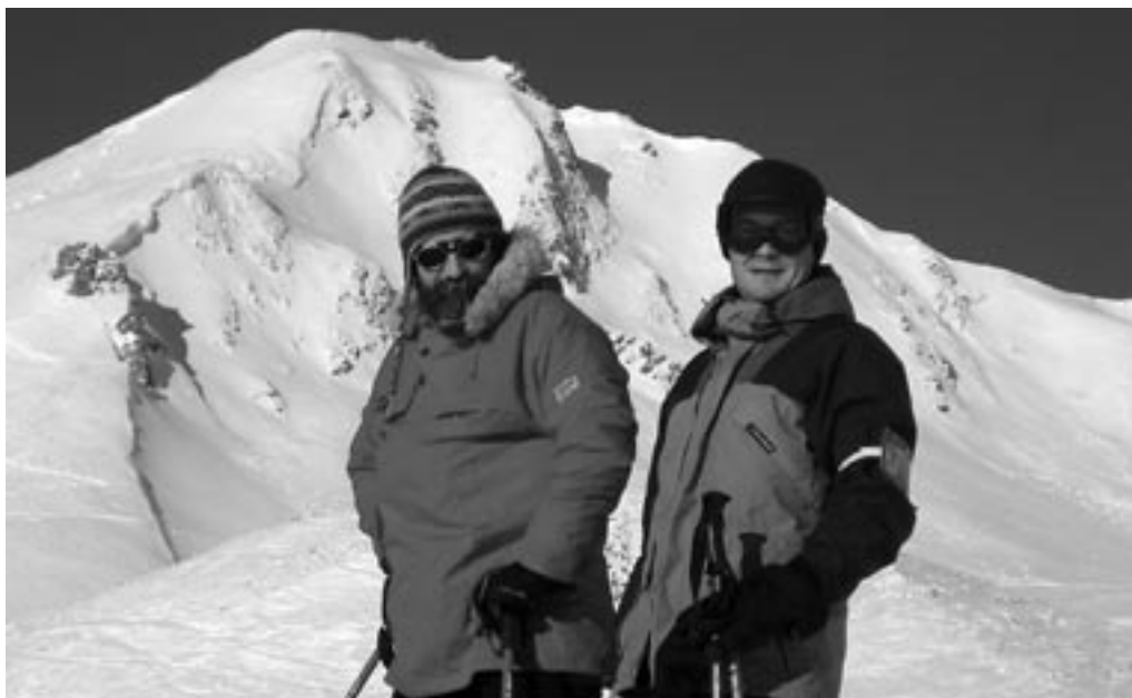
Udsigten i Norge. Flotte fjelde, søer og skov