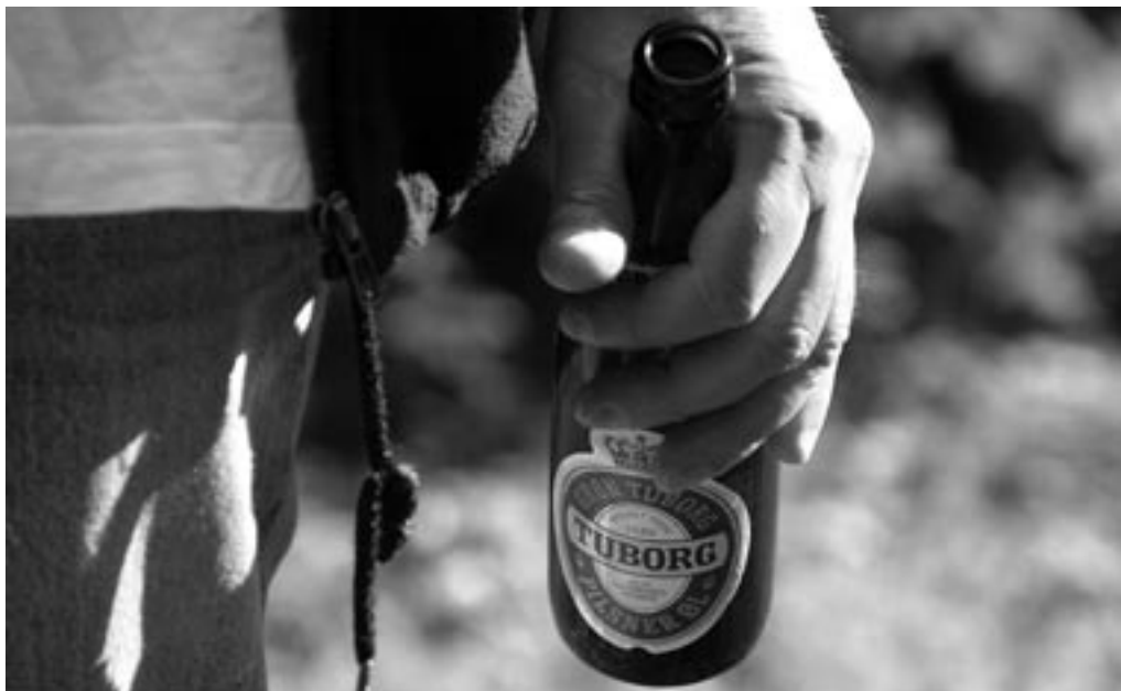
Der blev arbejdet , men også skyllet nogle håndbajere ned i de tørre halse