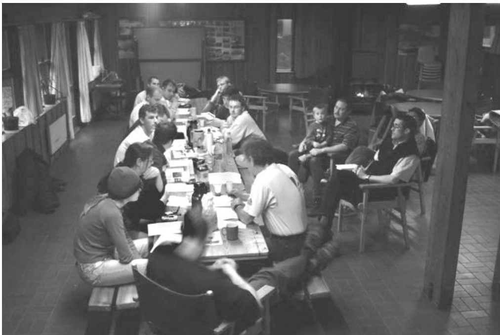
Jævnt fremmøde på kanoklubbens general forsamling år 2003