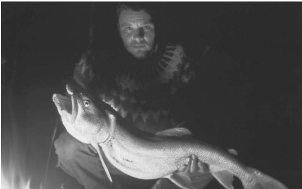
En 8 kg ørred fanget på Talson i Canada