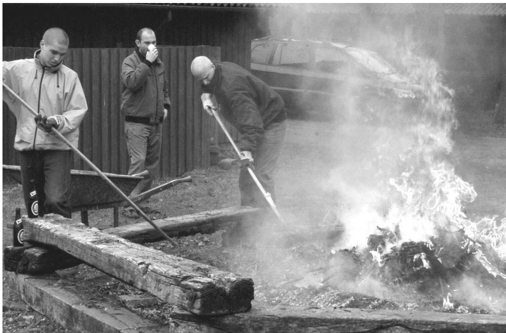
Drengene brænder bål