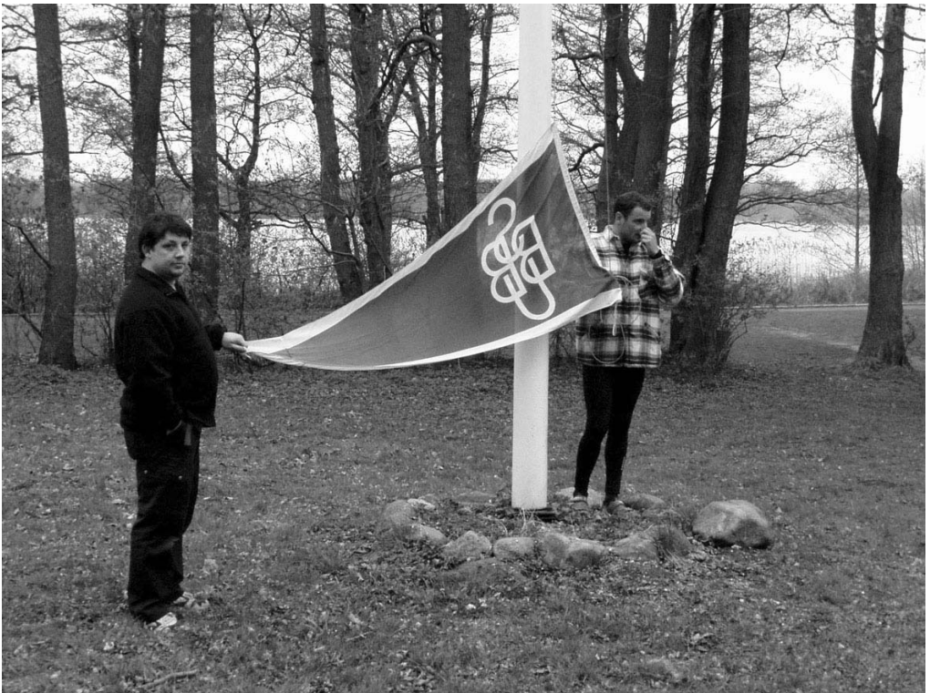
Formanden holder standertale