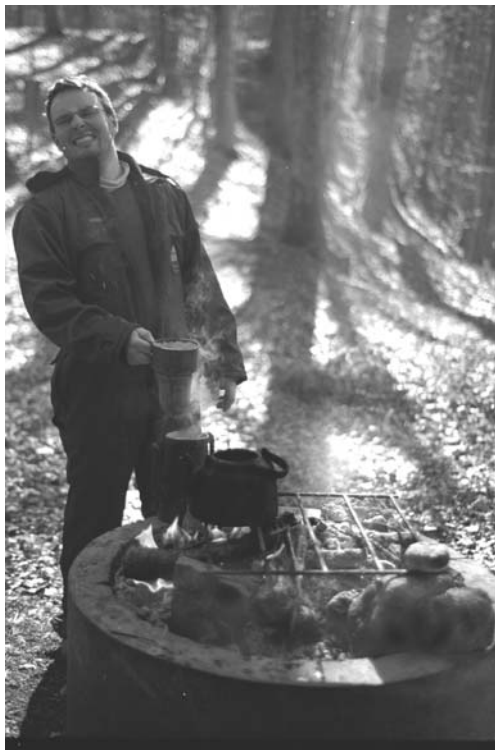
Butt laver kaffe

ske 7 – 8 hurtige pistolwhiskyer, ja og nogen havde efterladt Butthead med bar overkrop halvt ude af hans meget varme sovepose.