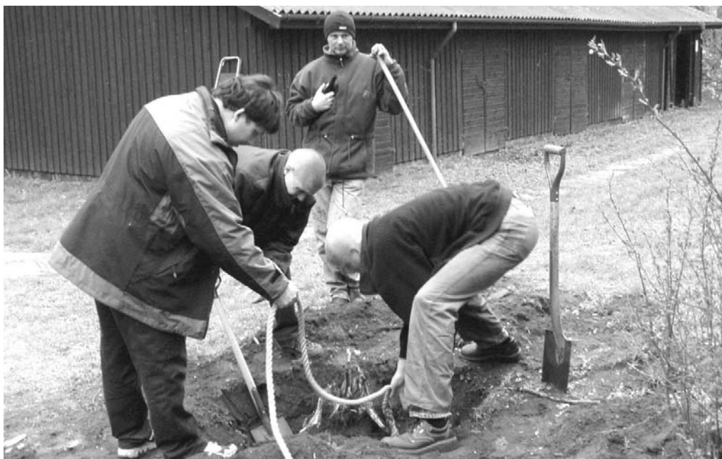
Villum holder vagt mens roden graves op