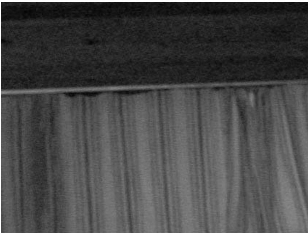
Computerene er lejnet op på stribe i SB

Jord til luft batterierne bliver hurtigt bemanded af vores soldater, og når B-52'eren kommer inden for skyderadius, brager geværer og kanoner, og sender en byge af ammunition mod flyet, som forsvinder i røg, for til sidst at eksplodere i et ildhav højt oppe over os. Vores flag hejses til top og blafrer i vinden. Alle soldaterne genlader deres våben, og hele styrken rykker videre mod den næste by som