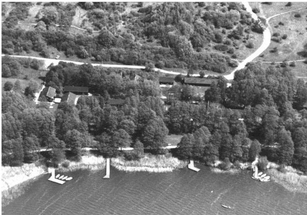
Lufffoto af kanoklubben

Klubbens formål er at give S.B.B.U.'s medlemmer mulighed for fritidsbeskæftigelse, herunder klubliv. Turroning og kaproning i kano og kajakporten. Endvidere