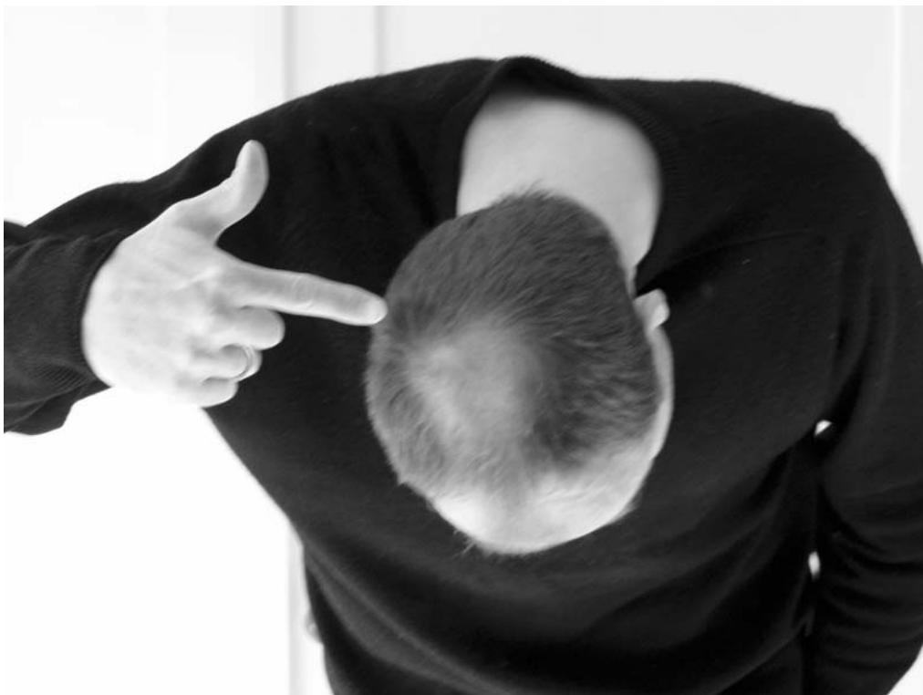
Det er her guldkornene kommer fra