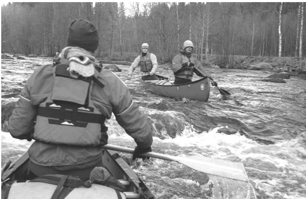
Drengene på Mørum