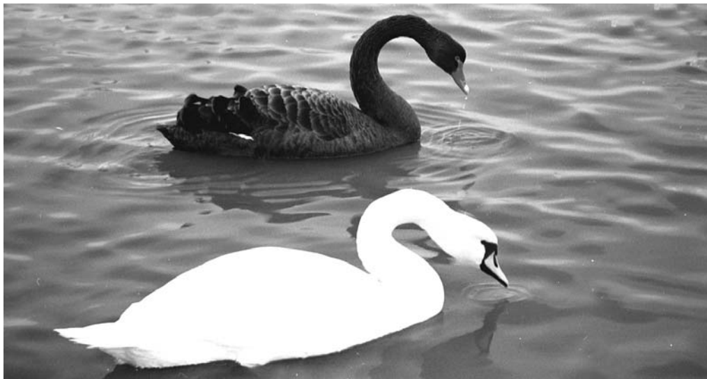
Sort hvide svaner

uden klubbens samtykke. Ethvert medlem er forpligtet til at arbejde i klubben, svarende til en weekends arbejde. Overholdes dette ikke pålægges et beløb i kontingentet og