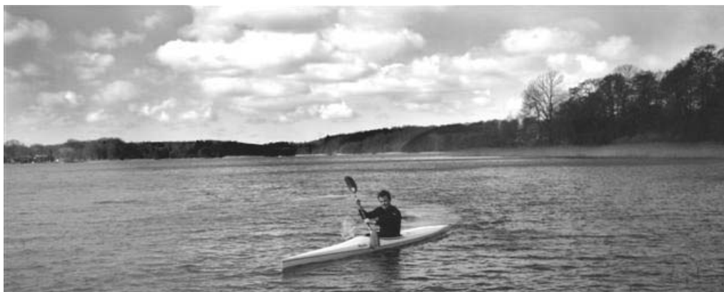
Kiks træner i SBBU's nye kajak