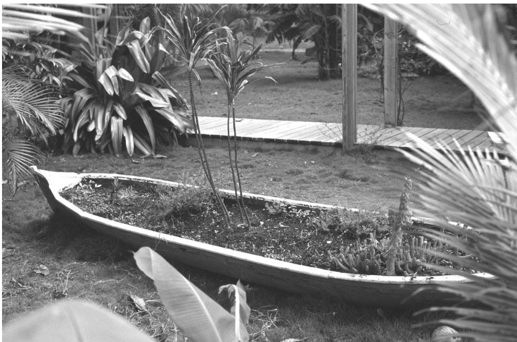
En alternativ måde at bruge sin kano på.

Send dem venligst til bladformanden eller giv dem til Vikkel.