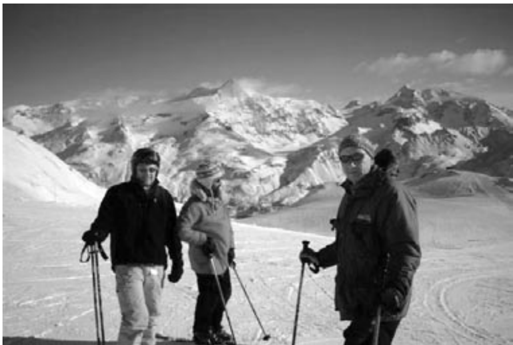
SBBU's telemarksdrengene klar til at angribe i alperne

Der er stadig et par pladser hvis det skulle have nogens interesse. Pris kr. 3700 - 4600, - alt efter om der står tomsenge i lejligheden. Hertil skal lægges penge til; mad, lomme-penge og evt. skileje. Ring til Vikkel.