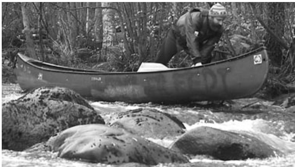
Efter denne tur blev den ellers legendariske fospadler Hviid kun kaldt for duk-duk