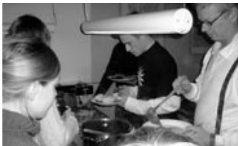
Hygge om madlavningen

Alle skal som når vi ellers er på tur, hjælpe til i køkkenet på skift samt deltage i det daglige samt afsluttende oprydning af rum, toiletter og bad.