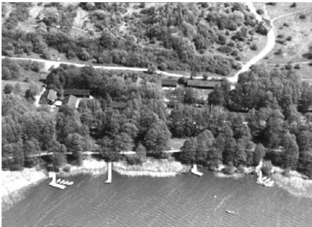
Kano & Kajakklubben SBBU fra luften