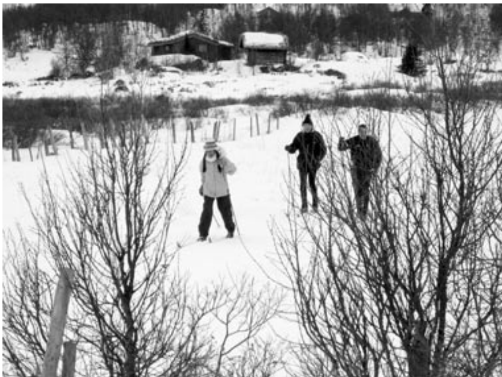
Norge er ideelt til langrendsture i fjellet