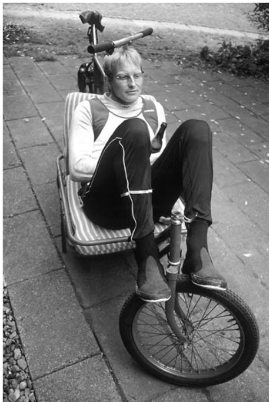
Lydmanden på sin long john og med en forsigtig i hånden.