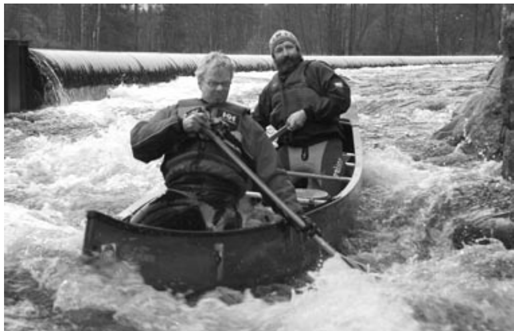
Ro på.. paniiiiik.. kæmpe..