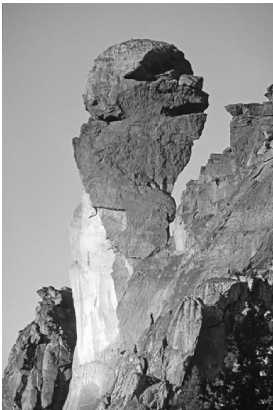
Mokey face, en legendarisk klatreklippe i Smith rock, Oregon.