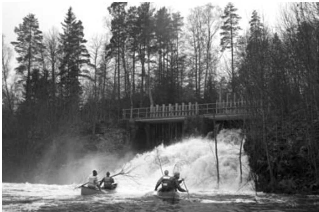
Vovehalsene skulle lige hen og snuse til drønene. (lige efter fingerflækker fossen)