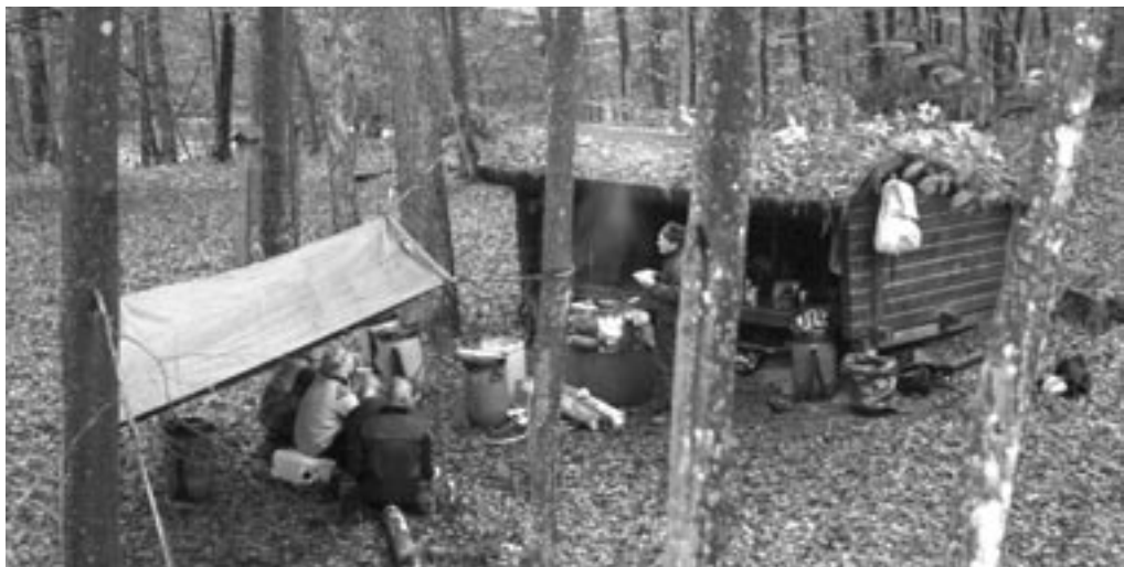
Madlavning lørdag aften forean det legendariske vindsjøt på Mørumsåen