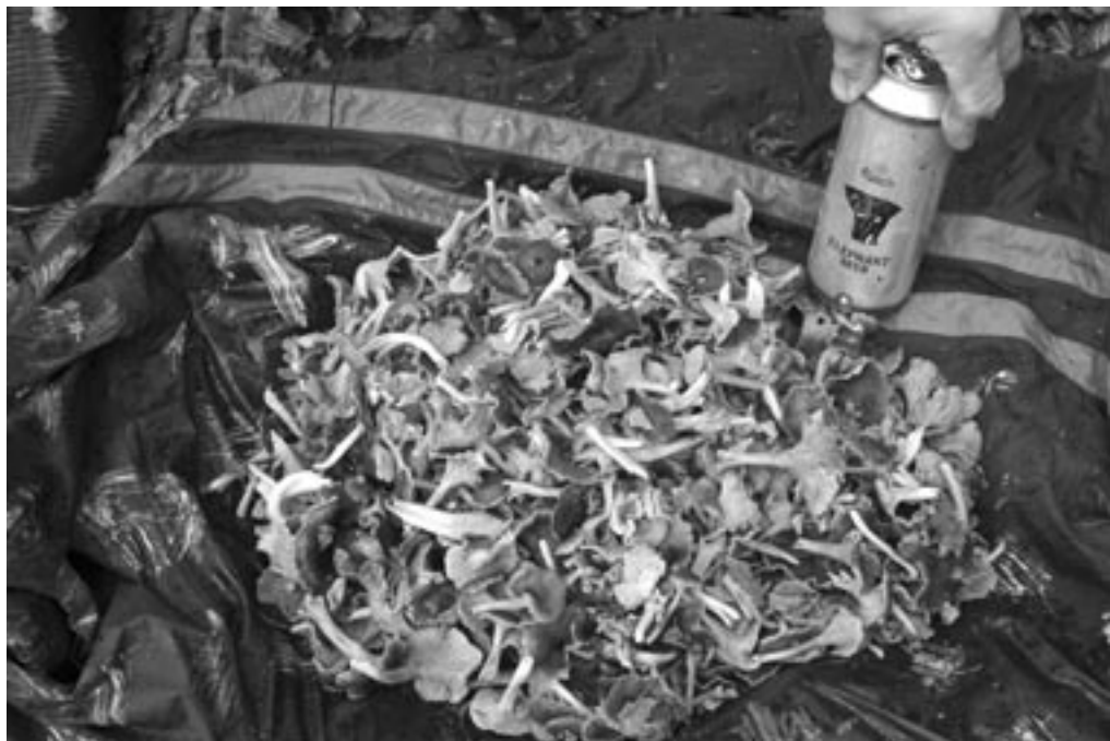
Pede og Lærlingen var på årets sejeste svampetur. 2-3 kg lækre kantareller.

Dagen efter iførte vi os våddragt og kørte til kantarel eldorado et svamperige uden lige og satte kanoerne i vandet og kom derudaf. Ved fingernflækker fossen