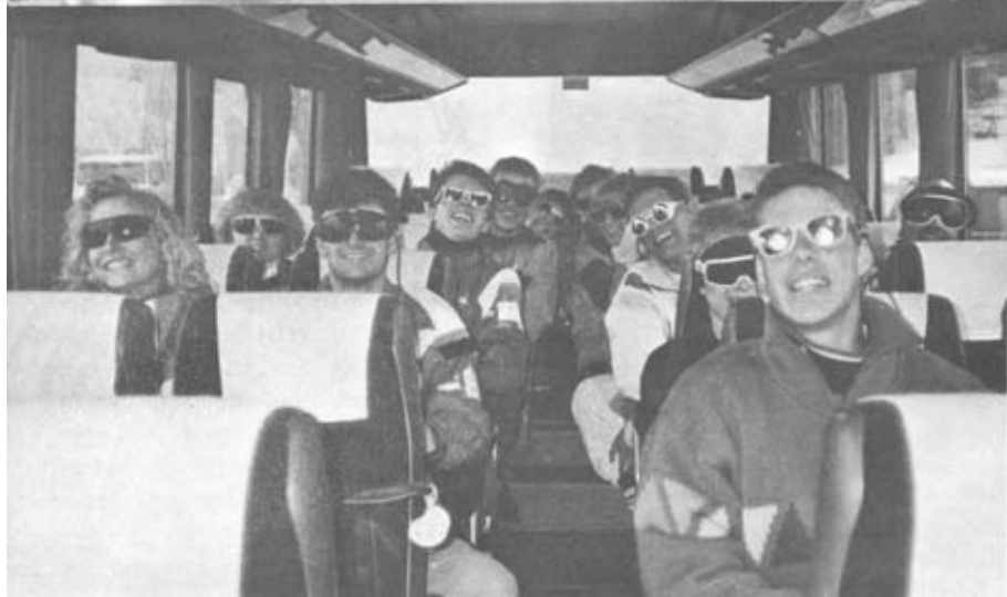
Redaktion og lay-out: Søren Vikkelsø. Tryk: SBBU's trykkeri. Antal eksemplarer: 550 stk. Tak til tidligere og nuværende SBBU'ere for manuskripter, fotos trukning m.v.